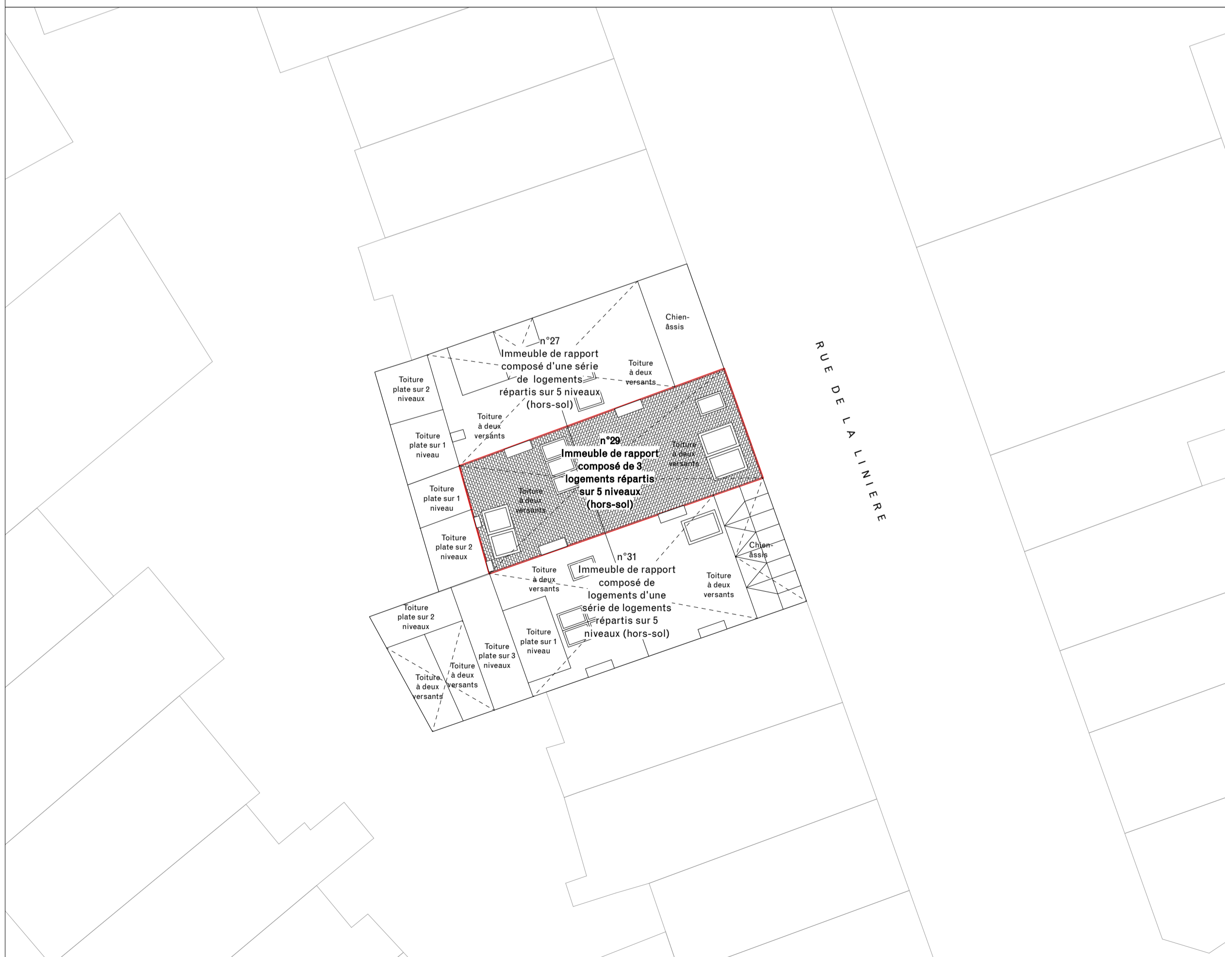
Situation existante - Plan d'implantation - 1/200